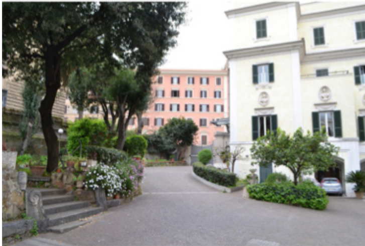
Fig. 4 – Il cortile interno dell'Istituto Scolastico Paritario “Figlie di Nostra Signora al Monte Calvario” (2016).

Nella scuola secondaria di I grado paritaria “Figlie di Nostra Signora al Monte Calvario” (fig. 4) dal 2005 è cominciata una politica di inclusione sociale